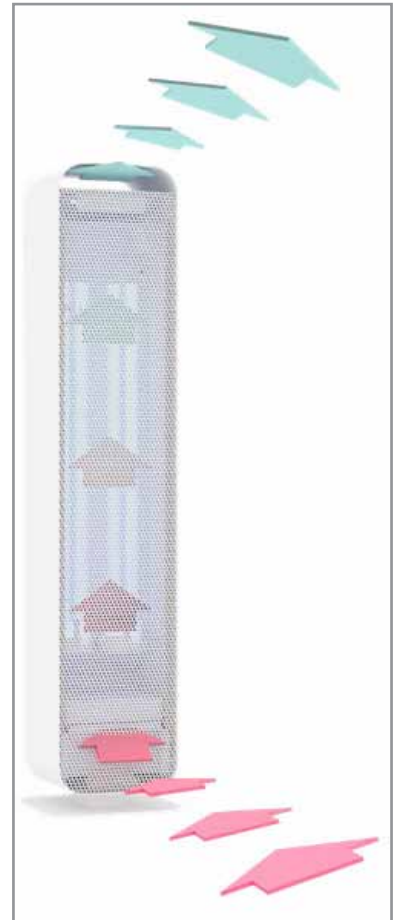
Luftführung durch das Geräteinnere